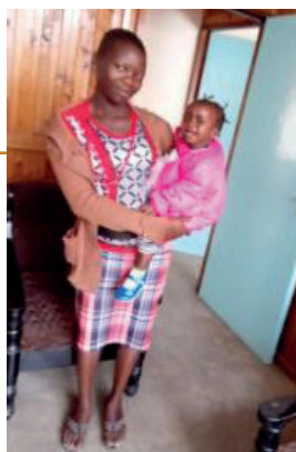
Mercy met haar kindje