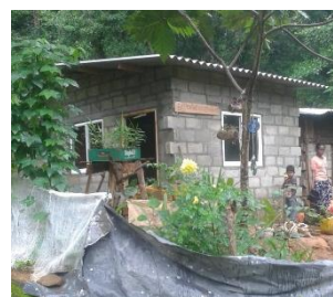
Foto vooraf de bouw en rechts is het huisje klaar. Midden achter staat Tine, met mondkapje.

en hielpen dagelijks mee met het sjouwen van stenen en zand vanaf de weg naar hun huis. Ook de vader, die een dagloner is, ging om de dag werken om geld te verdienen om zijn gezin te eten te geven, en andere dag thuis aan de slag. In 20 dagen was hun huis compleet!