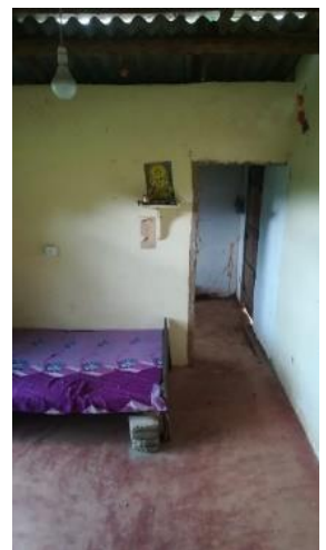
Foto links: oude situatie, Foto rechts: Een kamer van het nieuwe huisje

Met hulp van ons is het gelukt om in een naburig dorp een stukje grond met een klein huisje voor hen te vinden. Bestaande uit kamer, keuken, wc en voorzien van elektriciteit. Niet te beschrijven hoe blij het gezin was met hun eigen nieuwe stekje, waar ook de vijf jongens genoeg ruimte hebben om te spelen. Zodra ze erin konden verhuisden ze gelijk!